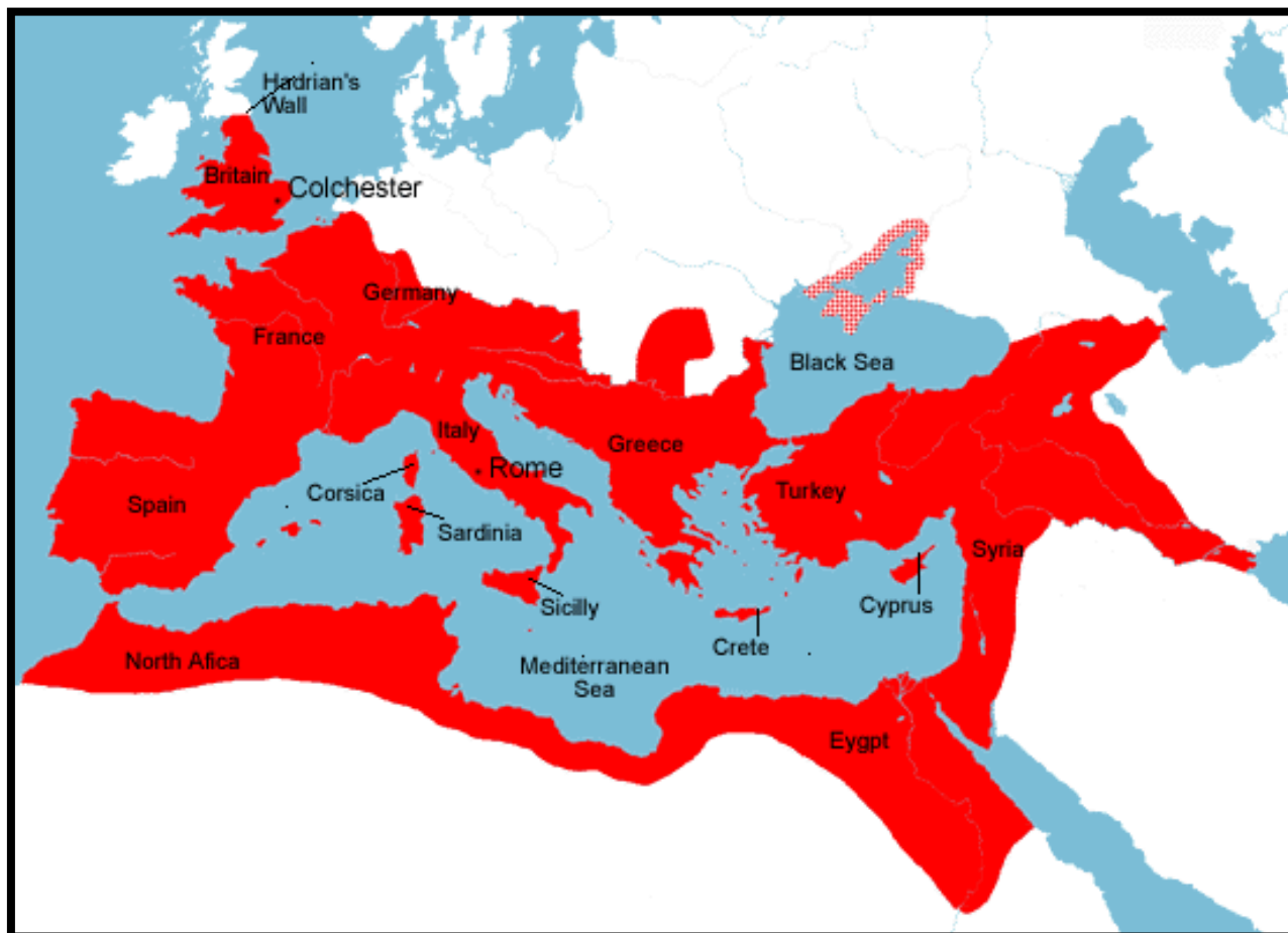
الإمبراطورية الرومانية في أوج اتساعها (حوالي عام 117 قبل الميلاد) The Roman Empire at its Greatest Extent About 117 A. D. 1