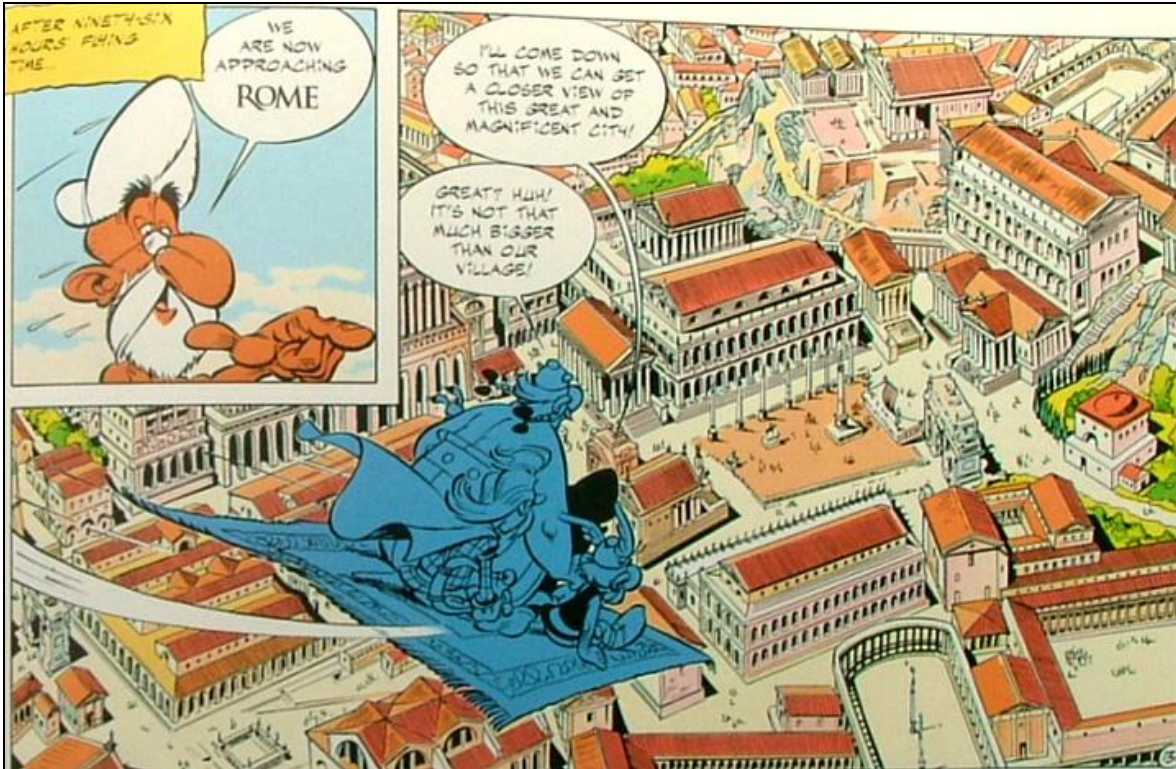
René Goscinny and Albert Uderzo, Asterix and the Magic Carpet