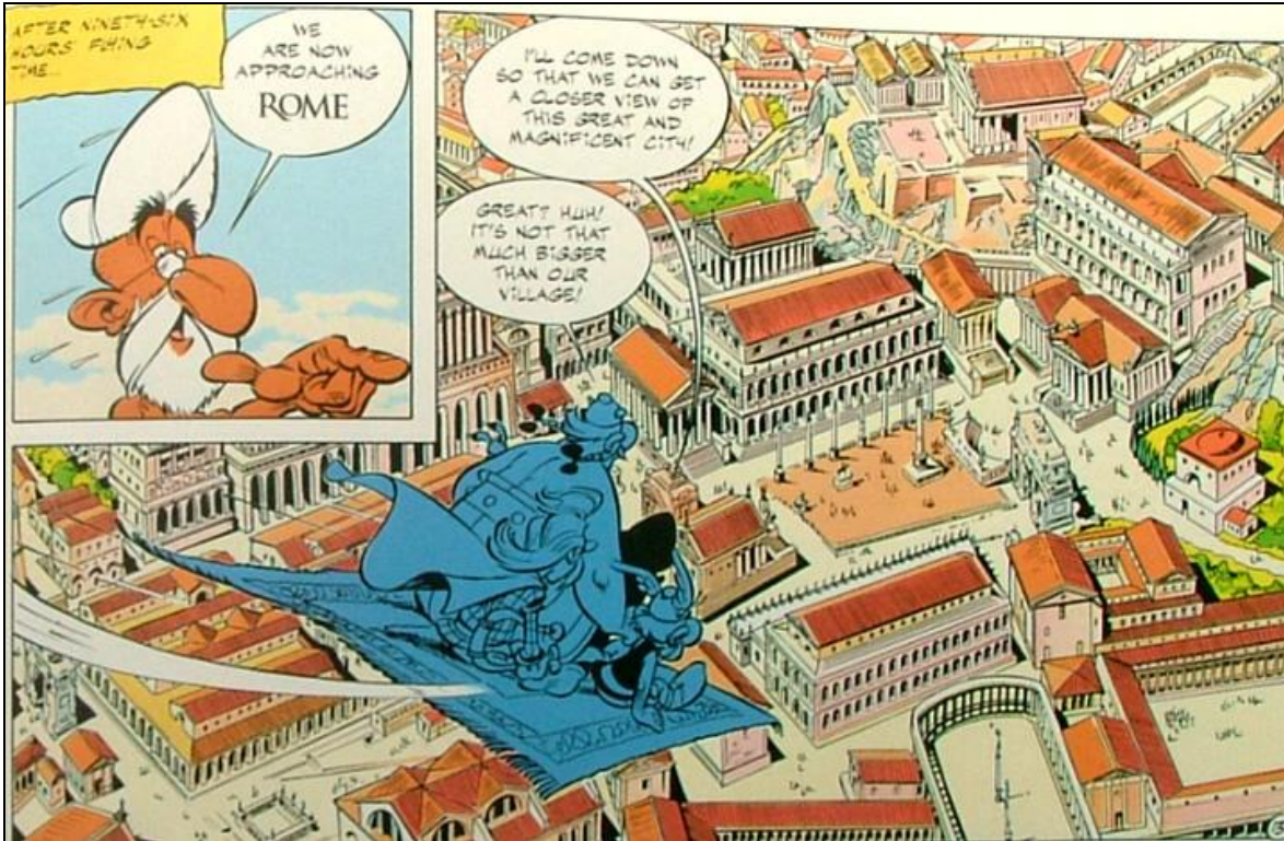
René Goscinny and Albert Uderzo, Asterix and the Magic Carpet